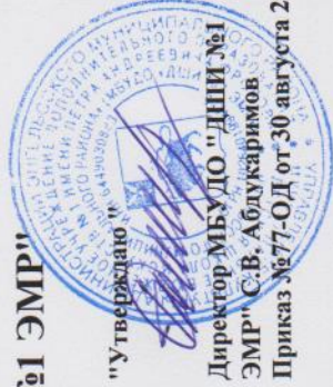
График образовательного процесса в МБУДО "ДШИ №1 ЭМР"

Дополнительная предпрофессиональная программа в области музыкального искусства "Духовые и ударные инструменты" Срок обучения 5(6) лет. 2024-2025 учебный год