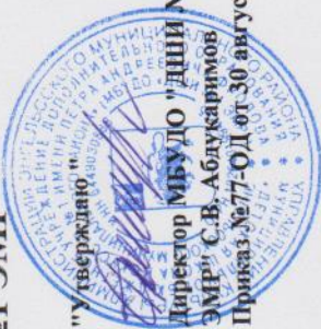
График образовательного процесса в МБУДО "ДШИ №1 ЭМР"

Дополнительная предпрофессиональная программа в области музыкального искусства "Фортепиано"