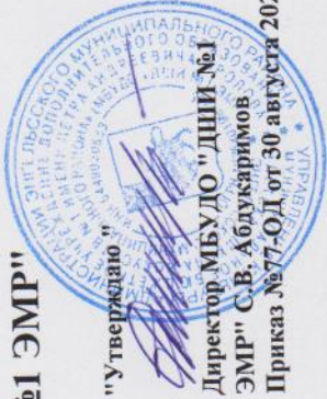
График образовательного процесса в МБУДО "ДШИ №1 ЭМР"

"Утверждаю" Директор МБУДО "ДШИ №1 ЭМР" С.В. Абдукаримов Приказ №77-ОД от 30 августа 2024 г.